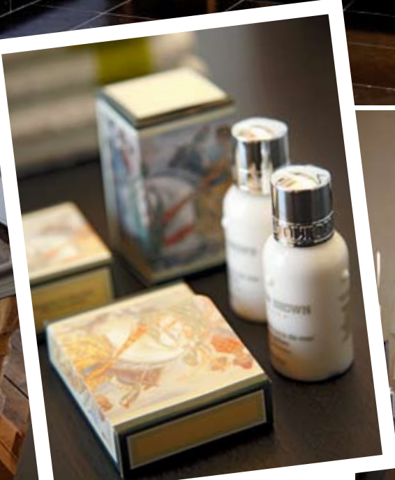
Dans chacune des deux chambres, les salles de bains balancent entre meubles patinés et accessoires contemporains.