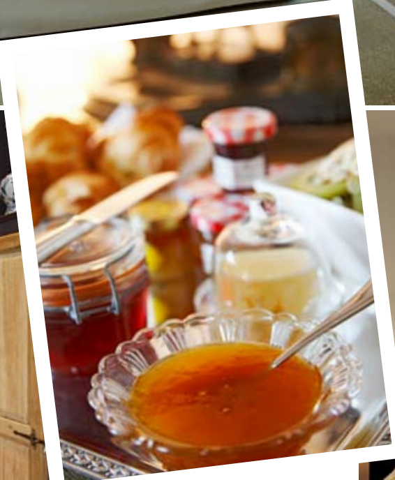
Des chambres lumineuses et confortables. Et le matin, un plateau de petit-déjeuner composé de viennoiseries, fromages, jambon, œufs, confitures maison et fruits frais.